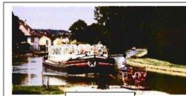
Le Canal à Lezennes