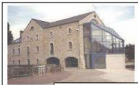
La Grotto du Moulin

Un espace pique-nique est à votre disposition avec barbecue.