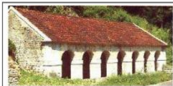
Le Lavoir d'Aisy-sur-Armançon